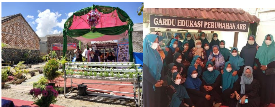
Foto : Wabup Sumenep dan pengurus PKK Perum ARB, saat peresmian Gardu Edukasi

Perumahan Agung Regency Babbalan (ARB) termasuk perumahan yang relatif baru di Kabupaten Sumenep. Walaupun relatif baru, warga yang berada di perumahan ini, terlihat aktif dalam melaksanakan beberapa kegiatan, salah satunya ada program Gardu Edukasi yang dirintis oleh ibu-ibu PKK. Gardu Edukasi merupakan salah satu program unggulan ibu-ibu PKK di Perumahan Agung Regency Babbalan (ARB). Perumahan ini terletak di Jl. Wijaya Kusuma Dusun Poto'an, Desa Babbalan Kecamatan Batuan. Dengan lokasi di pinggiran kota, perumahan ini, terlihat begitu asri dan nyaman. Walaupun, akses jalan menuju ke Perumahan ini masih belum begitu normal, karena belum diperbaiki oleh pemerintah daerah. Berdasarkan data pengembang yang melaksanakan proyek perumahan ini, Perum ARB terdiri dari 250 rumah, yang mulai digarap sejak 2016. Tetapi, berdasarkan info pengurus RT, yang resmi menempati perumahan ini hanya 60 KK dengan perkiraan 300 jiwa yang setiap hari berada di perumahan ini. Angka 300 ini merupakan jumlah dari pasangan bapak-ibu dan anak-anak yang mereka miliki.