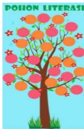
Gambar 5 Pohon Literasi

Pada SDN Karangduak II pojok baca literasi yang dimiliki masih belum maksimal untuk digunakan oleh siswanya, sehingga pada tim Pengabdian kepada Masyarakat akan merenovasi dan memperindah pojok baca literasi agar siswa merasa nyaman dalam membaca buku, mengajak siswa untuk dekat dengan buku, senang dalam membaca buku, dan menganggap membaca buku adalah hal yang menyenangkan bagi siswa. Hal ini bertujuan untuk meningkatkan motivasi literasi siswa dan bermuara pada peningkatan pengetahuan dan kreativitas siswa (Wulanjani & Anggraeni, 2019).