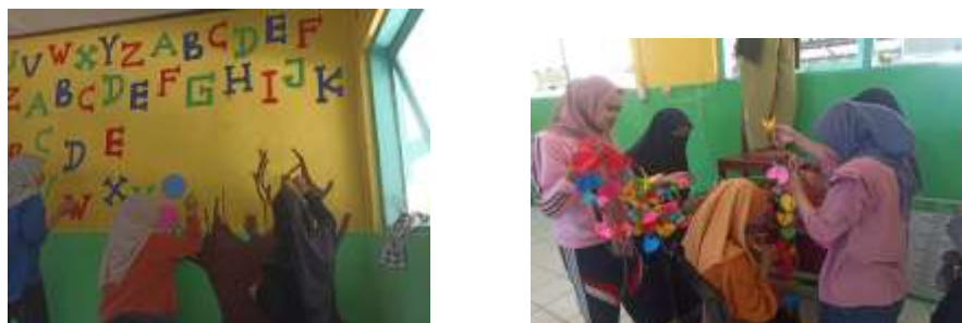
Gambar 12 Hari Kedua Pelaksanaan Bedah Kelas

yang sudah dibuatnya yaitu bertema literasi. Selain mendesain ruang kelas, fokus juga akan diberikan pada penyediaan aksesoris-aksesoris menarik seperti pembuatan burung-burung dari origami yang di pasang kan pada jendela, serta menambahkan buku-buku bacaan sebagai sumber belajar siswa.