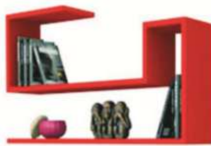
Gambar 6 Pojok Karya

Pembuatan pojok karya sebagai salah satu aksesoris atau lebih tepatnya yaitu tempat untuk menyimpan karya-karya siswa agar tidak mudah rusak dan terawat, siswa dapat menyimpan karya tiga dimensi mereka pada rak pojok karya ini, contohnya seperti karya manik-manik, topi rajut, dan sebagainya.