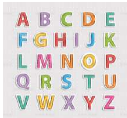
Gambar 2 Huruf Alfabet A sampai Z

Pada dinding kelas telah di lukis huruf-huruf alphabet yang disusun secara sistematis atau terurut dari huruf A sampai Z, lalu dilukis secara berulang dan berwarna yaitu warna hijau, biru, dan merah, tujuannya agar menambah nilai estetika pada dinding ruang kelas tersebut. Huruf-huruf alphabet ini tentunya dirasa sangat membantu siswa kelas I dalam mengenal macam-macam huruf sehingga dapat mudah menghafal dan memahaminya (Fitria, 2021).