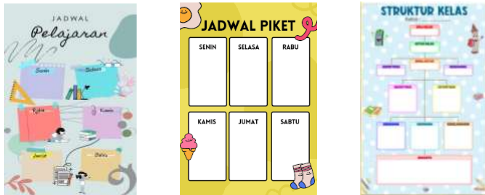
Gambar 9 Jadwal Piket, Pelajaran, dan Struktur Kelas

Aksesoris lain yang ditambahkan dalam ruang kelas ini yaitu poster jadwal piket siswa dari hari senin sampai sabtu, lalu juga jadwal pembelajaran siswa dari hari senin sampai sabtu, dan tentunya juga tak lupa membuat poster struktur di dalam ruang kelas tersebut mulai dari ketua kelas hingga bagian kebersihan kelas.