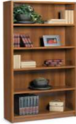
Gambar 8 Rak Buku

dapat menyimpan dan meletakkan buku-buku bacaan ataupun buku gambar dengan baik dan rapi, serta juga akan mempermudah siswa dalam mengakses buku-buku tersebut.