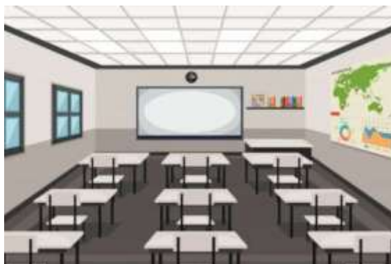
Gambar 10 Penataan Bangku