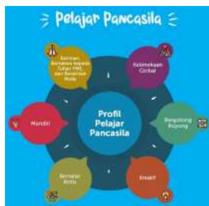
Gambar 3 Poster Profil Pelajar Pancasila

Selain itu juga terdapat poster pada dinding kelas yang berisi profil pelajar pancasila, sesuai dengan kurikulum merdeka bahwa setiap siswa harus mencerminkan dan mengamalkan setiap nilai atau dimensi yang terdapat pada profil pelajar pancasila.