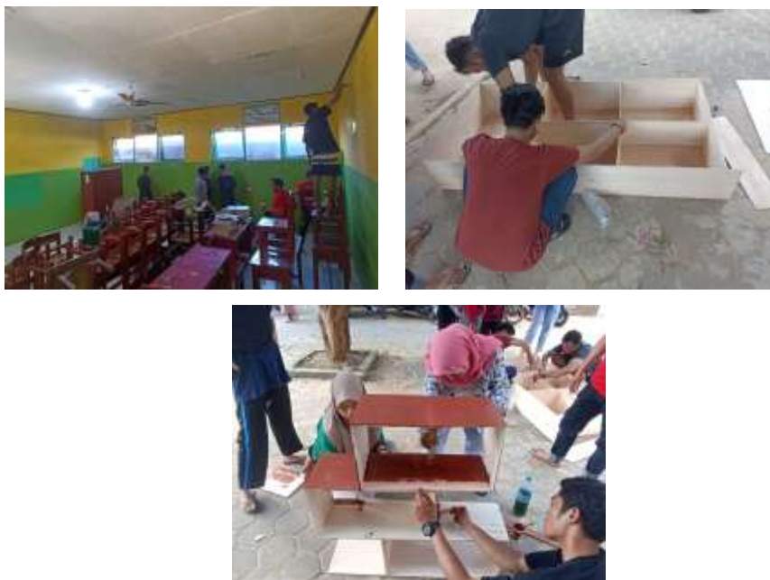
Gambar 11 Hari Pertama Pelaksanaan Bedah Kelas