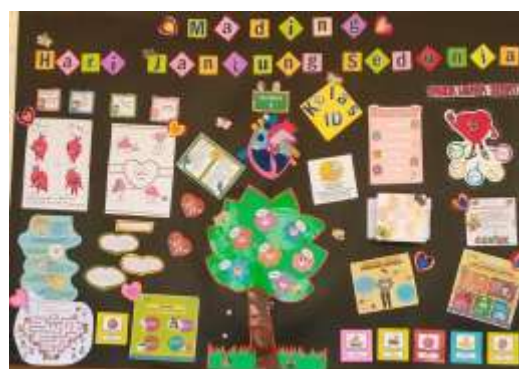
Gambar 7 Mading Kelas

Selanjutnya terdapat pembuatan mading kelas dengan disertai beberapa map yang digantung sejajar di sampingnya, pembuatan mading tersebut bertujuan agar siswa dapat menempelkan karya tulis ataupun lukisan - lukisan mereka, dan jika merasa tidak cukup maka siswa dapat menyimpannya dengan rapi pada map-map yang sudah tersedia, agar karya-karya siswa tersebut tidak hilang dan rusak (Satria & Afrita, 2018).