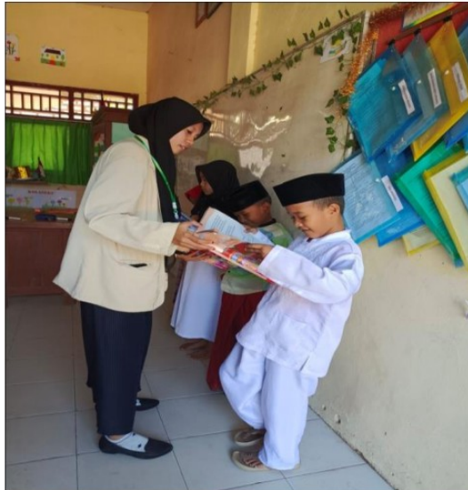
Gambar 1. Bimbel ( Bimbingan Belajar Membaca)