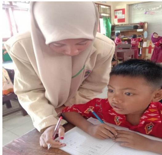
Gambar 2. Bimbingan Belajar Menulis